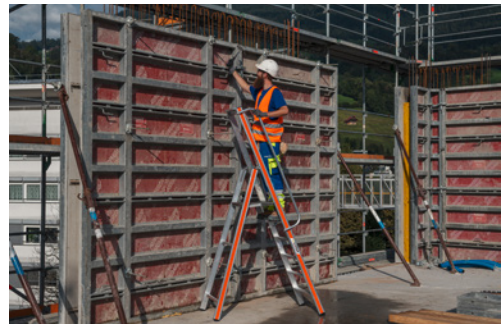
5 Arbeiten auf einer leichten Plattformleiter an einer Wandschalung