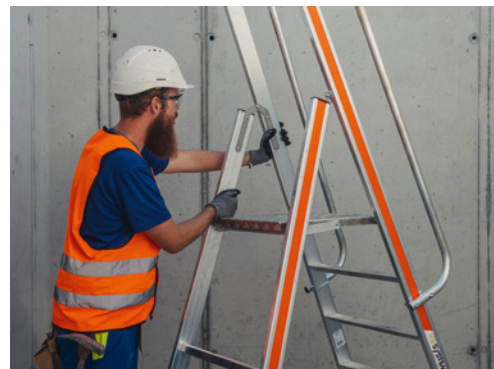
9 Sichtkontrolle vor der Benutzung