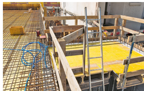
8 Die Leiter ragt mindestens 1 m über die Ausstiegskante, ein sicherer Überstieg mit Geländern ist sichergestellt.