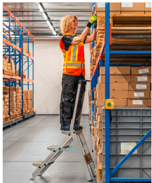
6 Sicheres Arbeiten auf einem Tritt