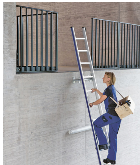
7 Leiter sicher besteigen: Blick zur Leiter, gutes Schuhwerk, mit beiden Händen sicher festhalten, Material in Transportkiste.